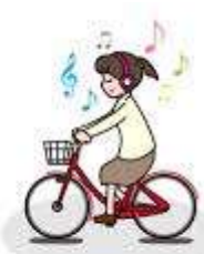
イヤホン等使用運転