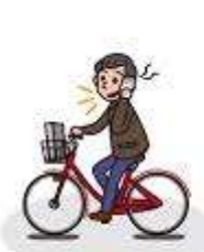
スマホ等使用運転